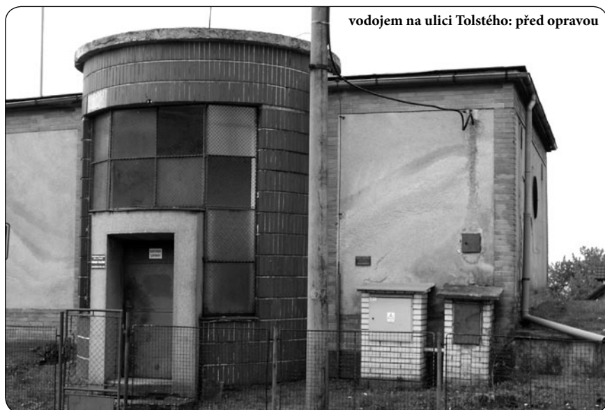
vodojem na ulici Tolstého: před opravou

Vážení spoluobčané, milí zákazníci, dovolte mi, abych vám v úvodu jménem Vodohospodářské společnosti Sitka, s. r. o. poděkoval za spolupráci v roce 2014 a zároveň popřál hodně zdraví, štěstí a osobní spokojenosti v roce 2015.