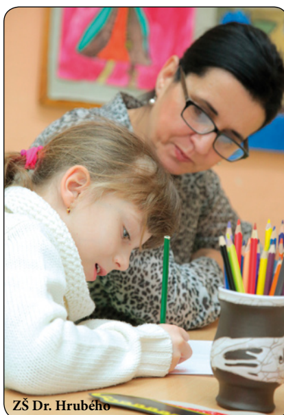
ZŠ Dr. Hrubého