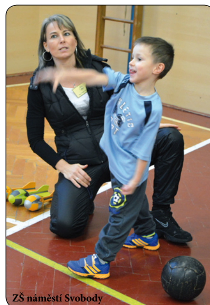
ZŠ náměstí Svobody

Zápis dětí pro školní rok 2015/2016 se konal 16. ledna 2015 na všech třech základních školách ve Šternberku: ZŠ Svatoplukova, ZŠ Dr. Hrubého a ZŠ náměstí Svobody. K zápisu přišlo celkem 219 dětí; předpokládá se, že v září usedne do školních lavic pravděpodobně 174 prvňáčků. V loňském roce se zápisu zúčastnilo 223 dětí, předloni jich bylo 214. (red)