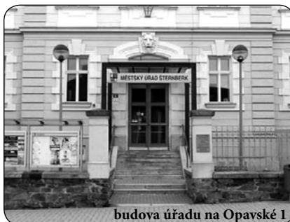
budova úřadu na Opavské 1

Žádáme občany, kteří dosud nejsou v evidenci , v roce 2015 dovrší výše uvedené jubileum a mají zájem o osobní návštěvy členů Sboru pro občanské záležitosti spojené s gratulací a předáním dárkového balíčku, aby vyplnili formulář s názvem „Souhlas se zpracováním osobních údajů pro účely blahopřání jubilantům“. Tento formulář je k dispozici na