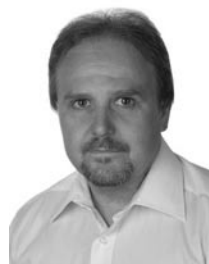
21. Zbyněk Kryl